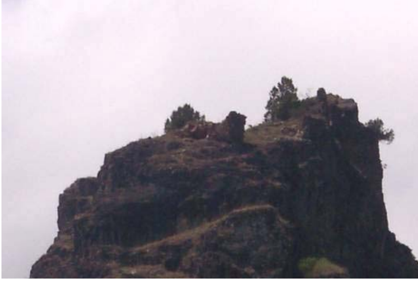
Figür-13. Cevizlik Kalesi