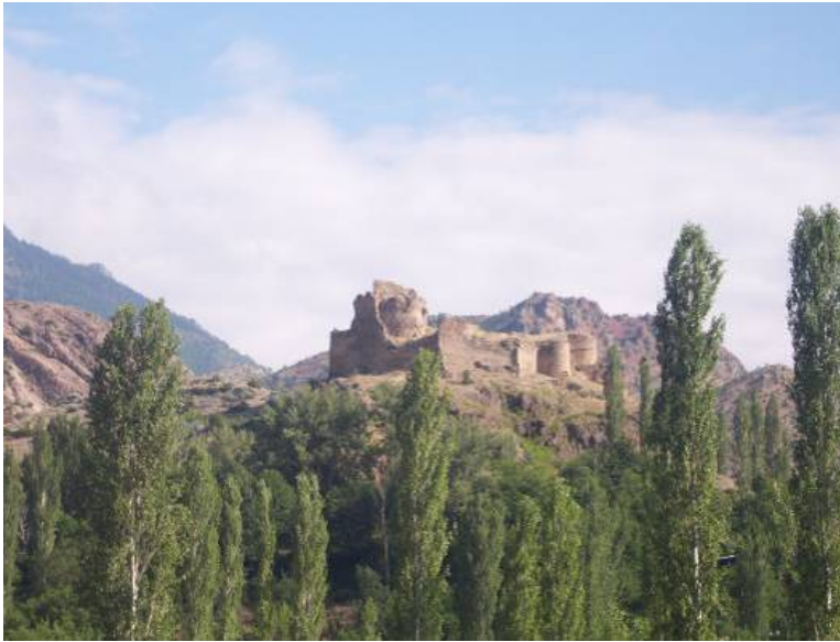
Figür-6. Çevreli Kalesi