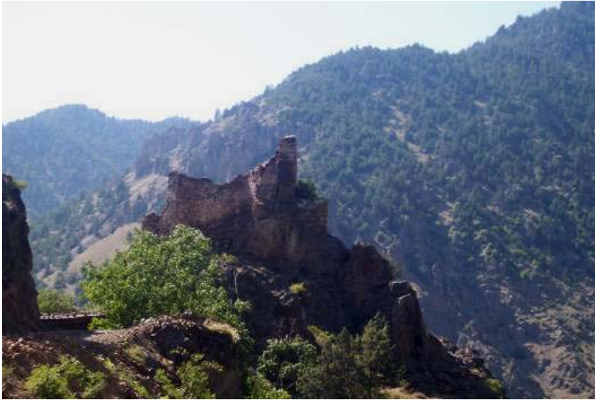
Figür-4. Esendal Kalesi