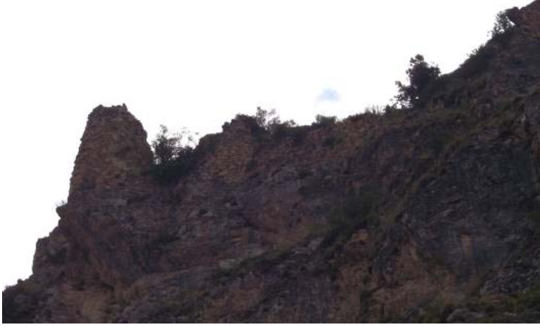
Figür-11. Demirkent Kalesi