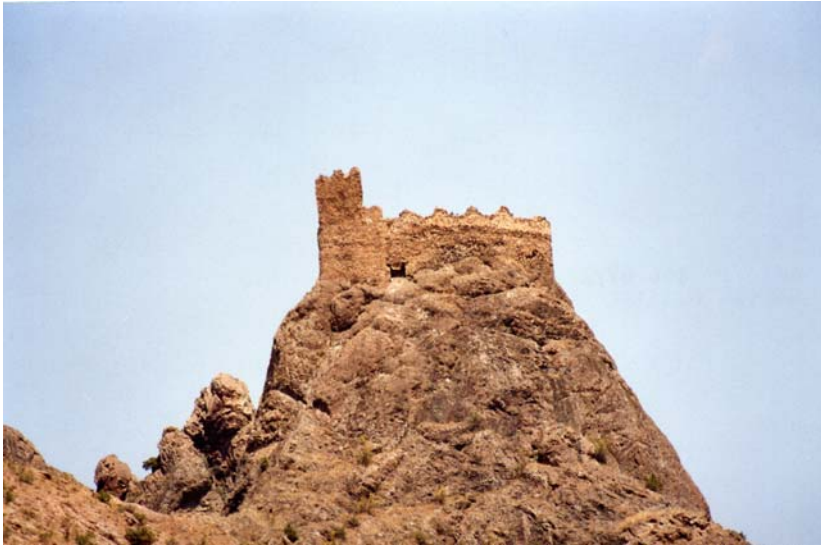
Figür-2. Bahçeli Kalesi