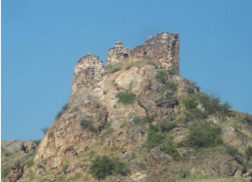
Figür-14. Köprügören Kalesi