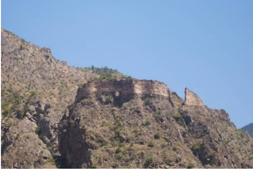
Figür-3. Bostancı Kalesi