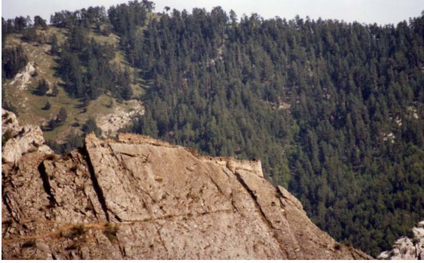
Figür-9. Darıca Kalesi