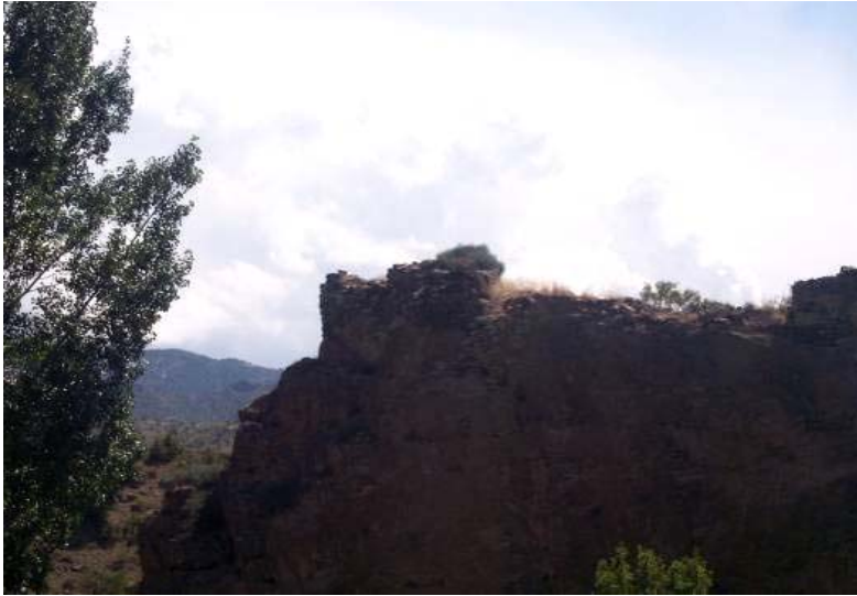
Figür-8. Çiftlik Kalesi