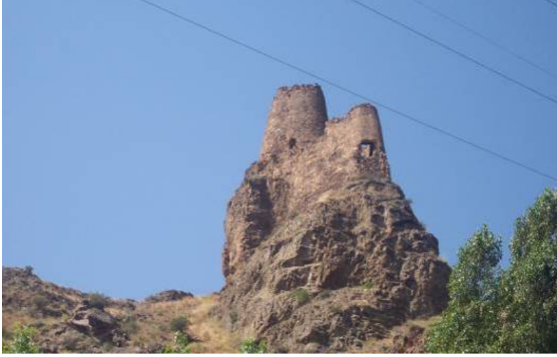
Figür-1. Kınalıçam Kalesi