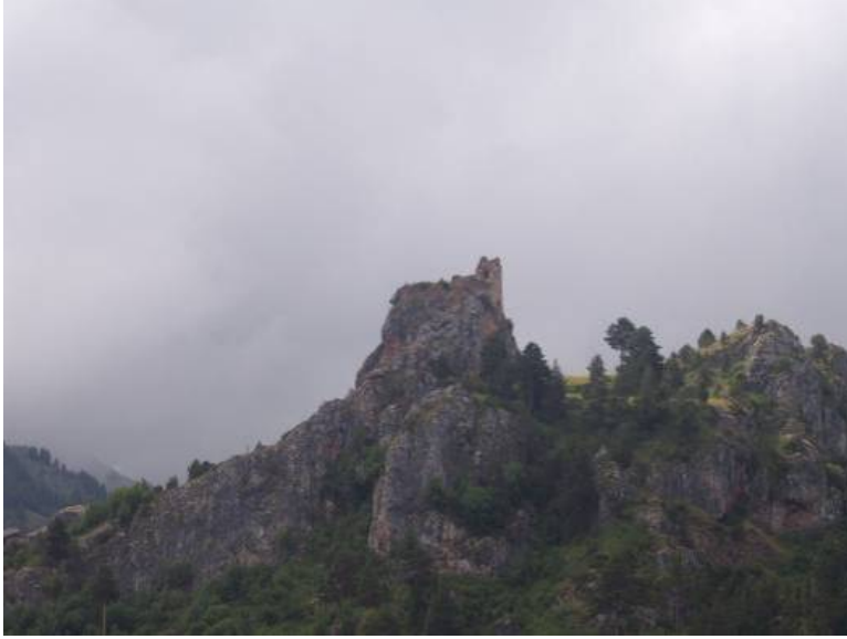
Figür-7. Kılıçkaya Kalesi