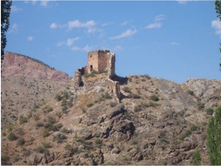
Figür-10. Yokuşlu Kalesi