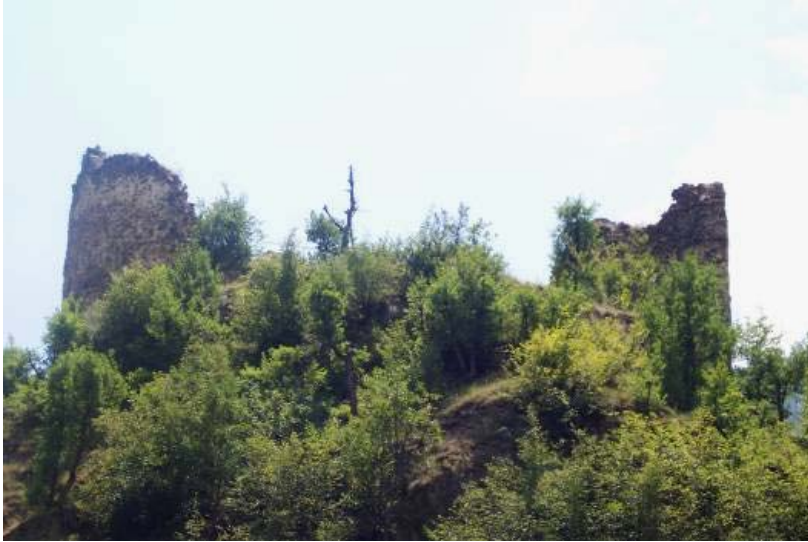
Figür-12. Demirköy Kalesi