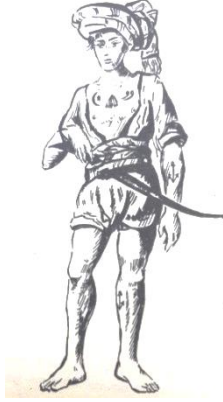
Şekil 1. Cezayir Kesimli Bıçkın (Koçu 1996: 90).

Cezayir esvabı veya Cezayir kesimi olarak nitelendirilen giyim kuşam özelliği başındaki sarıktan, belindeki bıçağa, göğüs aksesuarından diz çakşırına kadar birçok parçanın bir araya gelmesiyle bir tarz oluşturmaktadır.