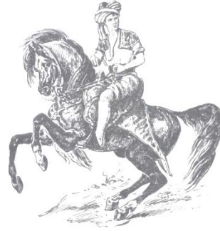
Şekil 3. Cezayir Kesimli Ayakları Çıplak Küçükbey (Koçu 1996: 91,92).

Gerçekte bu tarz, boyun eğmez, fakir, asi gençlerin bir sembolüdür. Cezayir kesimi giyim tarzı daha çok Osmanlının alt kültürde yetişen kişiler benimsemiş ve bu guruplar arasında daha yaygın kullanılmasına rağmen, dönemin üst sınıf ailelerinin gençleri de bu akıma kapıldığı çeşitli kaynaklarca belirtilmektedir.