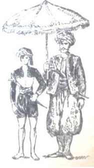
Şekil 2. Cezayir Kesimli Küçükbey

Cezayir esvabı veya Cezayir kesimi olarak nitelendirilen giyim kuşam özelliği başındaki sarıktan, belindeki bıçağa, göğüs aksesuarından diz çakşırına kadar birçok parçanın bir araya gelmesiyle bir tarz oluşturmaktadır.