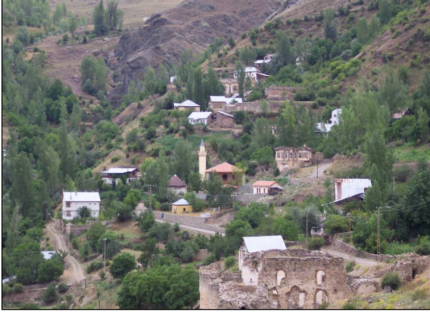
Resim 1. Eski Gümüşhane - Canca