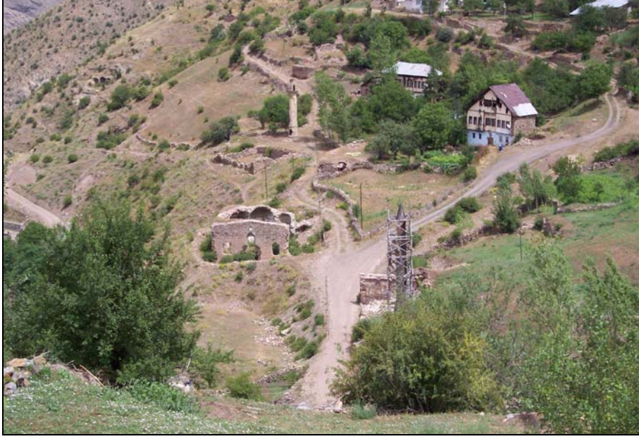
Resim 2. Eski Gümüşhane - Canca